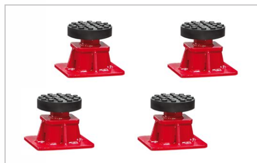
No.4 Tamponi di supporto