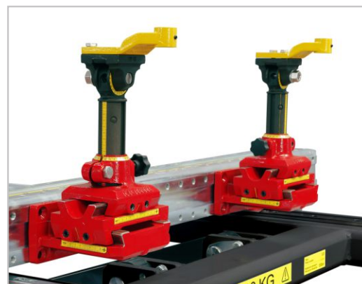
Système de Gabarit Universel