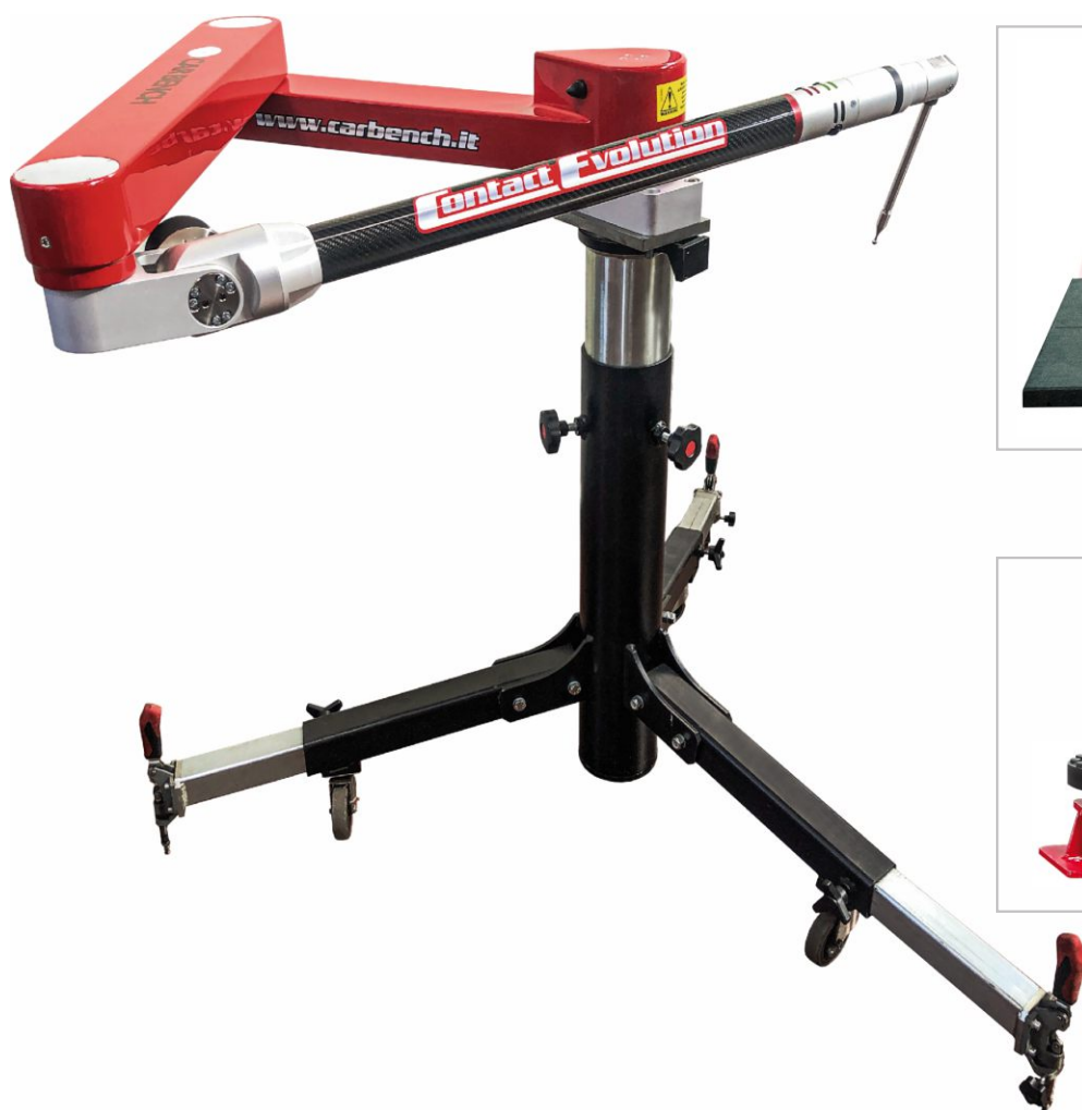
Sistema de medición electrónica Contact Evolution

Es posible añadir el Sistema de Plantilla Universal original de Car Bench , abrazaderas específicas del fabricante y para camionetas y SUV, el sistema de tiro por abajo, alfombrillas espaciadoras para coches deportivos, almohadillas de apoyo y el sistema de medición electrónica Contact Evolution .