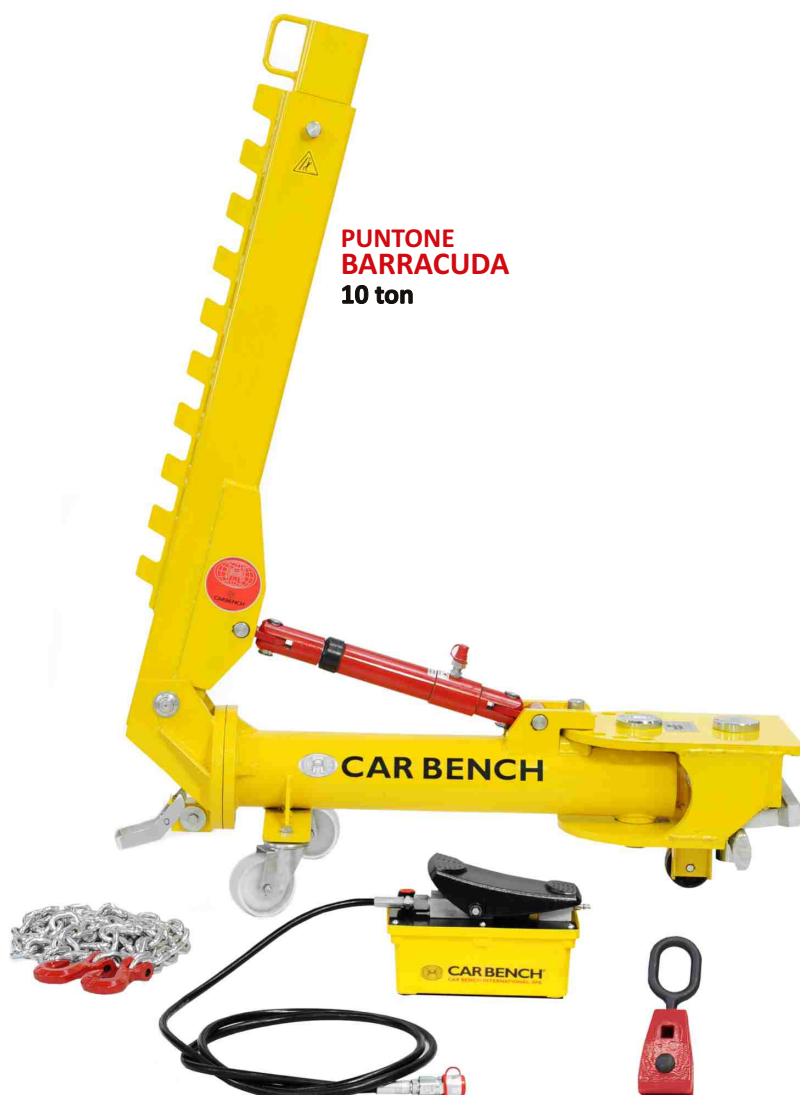
PUNTO BARRACUDA 10 ton