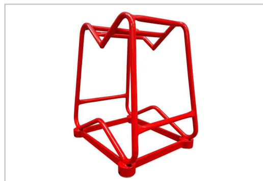
norte. 4 soportes móviles