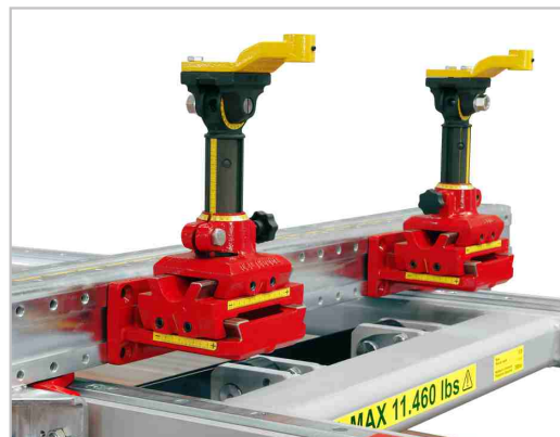
Sistema de plantilla universal