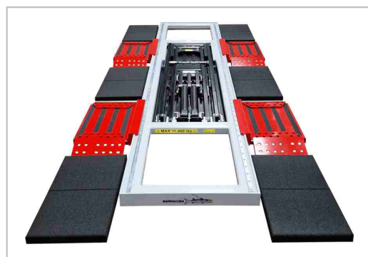
Kit de espaciadores para coches deportivos, 50 mm