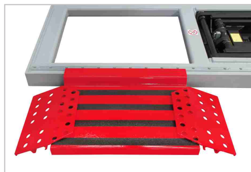
Kit de tope de rueda