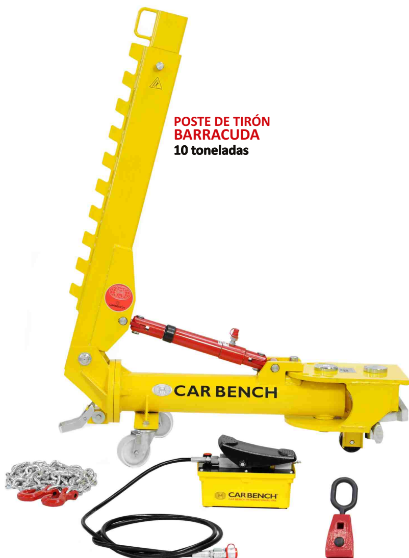
POSTE DE TIRÓN BARRACUDA 10 toneladas