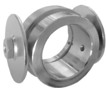
Carrello per compasso per CP 40