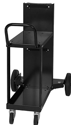
Carrello per trasporto generatore