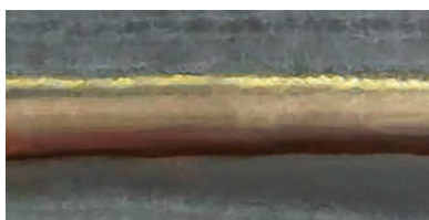
Soldadura fuerte con hilo CuSi 3