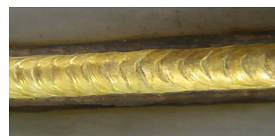
Soldadura fuerte con hilo CuAl 8