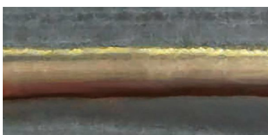
Soldadura fuerte con hilo CuSi 3