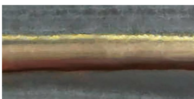
Brasage avec fil CuSi 3